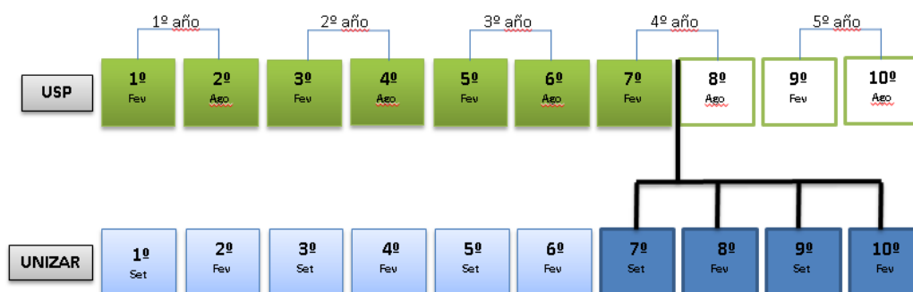
TABLA 5 – Organigrama de intercambio de estudiantes procedentes de la FMVZ/USP en UNIZAR